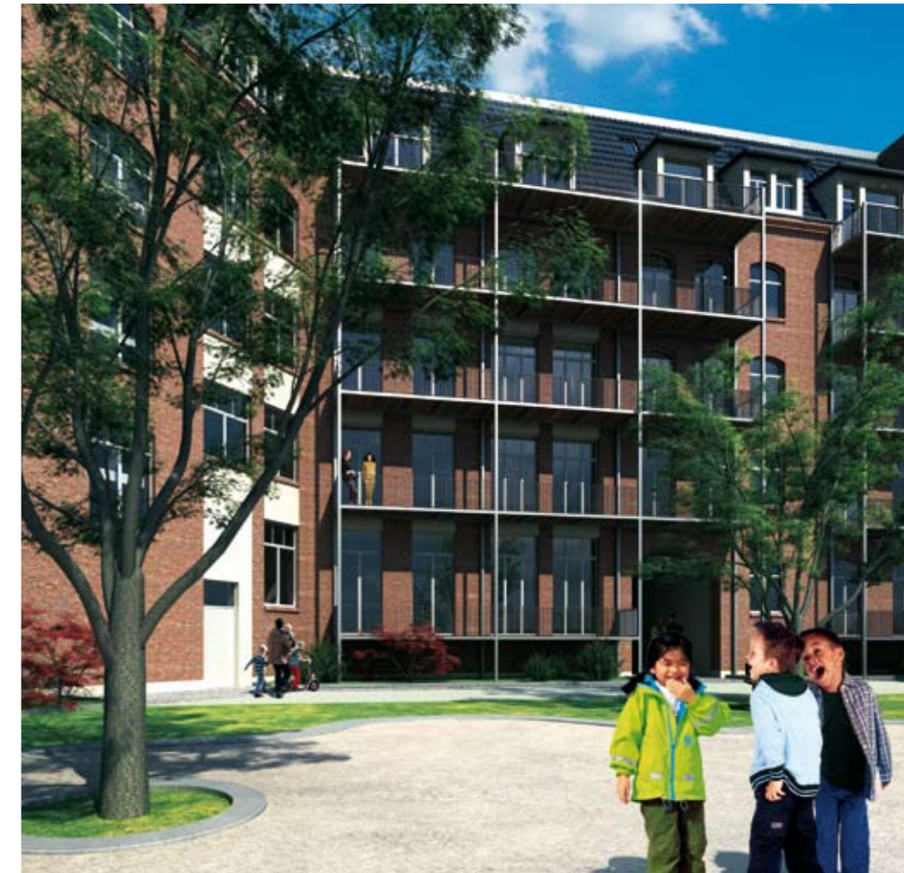
Thälmannstraße 5, Hofseite