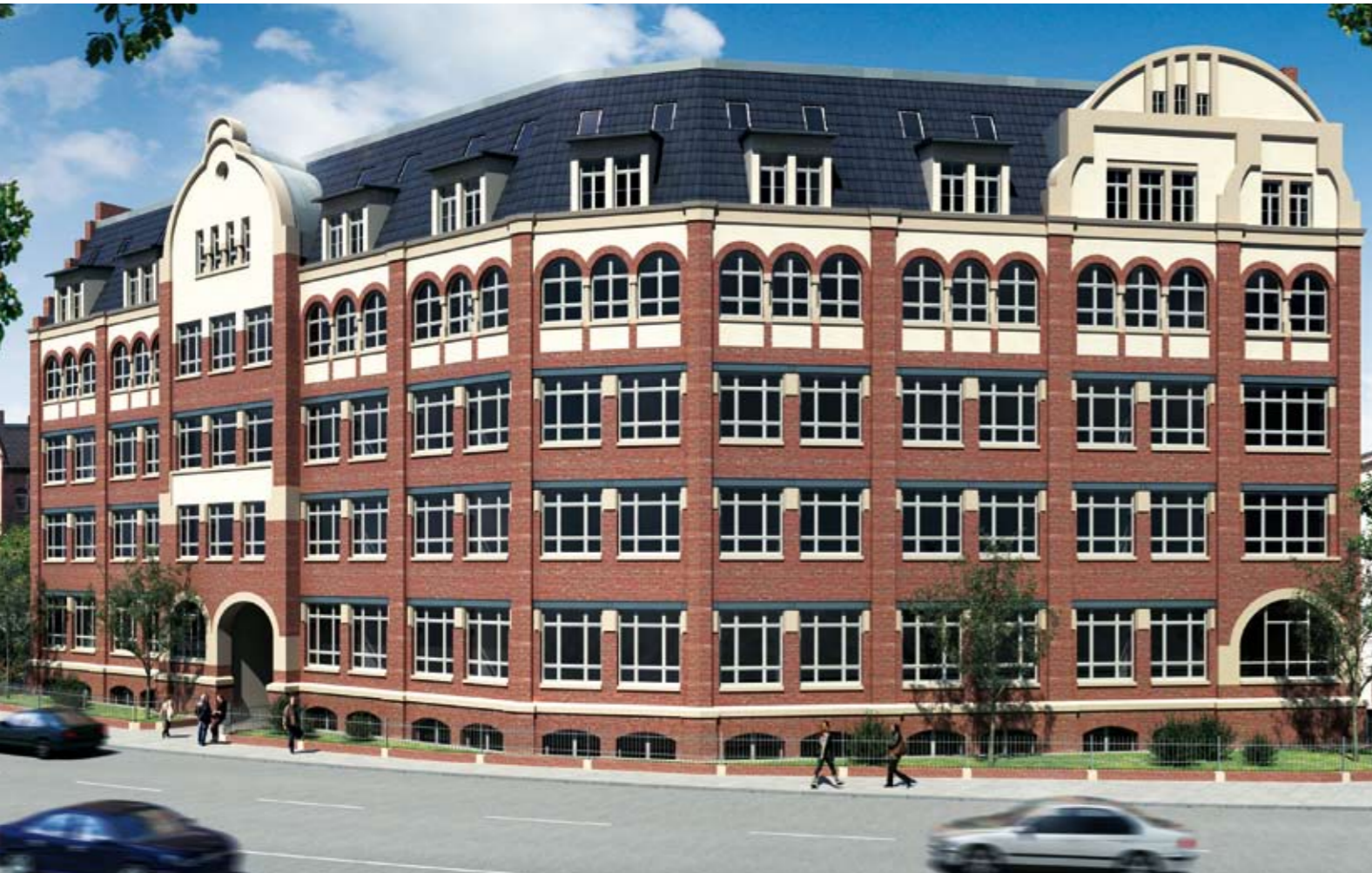
Thälmannstraße 5, Straßenseite

Sichern Sie Ihr Vermögen mit unseren Immobilien